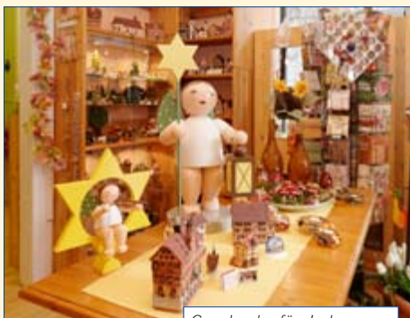
Geschenke für Jedermann

Die schönsten Geschenke haben wir für Sie in der Tübinger Geschenke Galerie am Holzmarkt ausgesucht. Egal ob unsere Exklusiv-Souvenirs, wie der Stocherkahn in der Streichholzschatel und die Tübinger Keramiklichterhäuser oder die weltbekannten Miniaturen der Fa. Wendt & Kühn. Moderne Glaskunst, Skulpturen, Glasschmuck, Bunzlauer Keramik, Weihnachtsartikel aus dem Erzgebirge, Zinnfiguren und Ornamente – bei uns finden Sie Geschenke für Jedermann und jeden Geldbeutel. ■