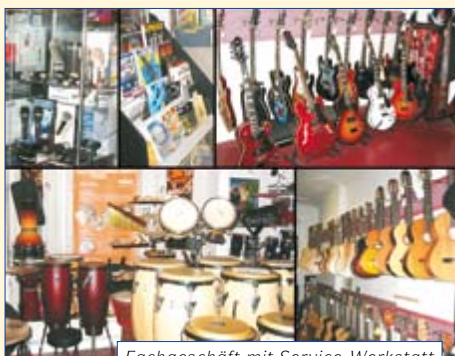
Fachgeschäft mit Service-Werkstatt

Technikausstattung für Einsteiger und Fortgeschrittene. Zeitgemäße Musikelektronik und Software gehören selbstverständlich zum vielseitigen Angebot. Schauen Sie vorbei. ■