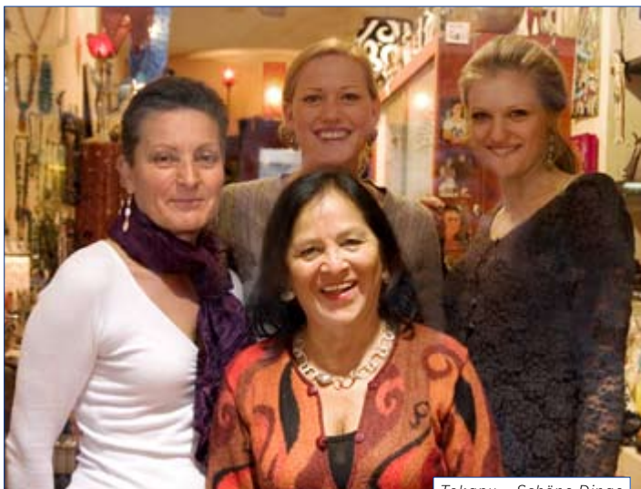
Tokapu – Schöne Dinge

Tokapu bedeutet in Quechua, der Indiosprache in Peru „schöne Dinge“. Darum finden Sie hier erlesenen und preiswerten Schmuck, schöne Textilien und authentisches Kunsthandwerk aus Lateinamerika und anderen Weltregionen. Tokapu ist nicht einfach ein Laden, sondern auch ein Treff für Menschen aus den verschiedensten Kulturen. Kommen Sie, sehen Sie sich um und Sie werden begeistert sein. ■