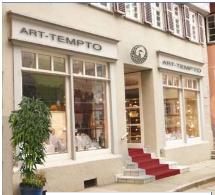
Goldschmiedekunst, Fotografie, Druckgrafik und Lichtobjekte

ART-TEMPTO – der Name steht für die Freude am Erschaffen und für eine außergewöhnliche Kombination der feinsten Künste: Die Goldschmiede für Unikatschmuck, das Atelier für Portrait-Fotografie, die Werkstatt für Goldstickereien und Druckgrafik sowie die beeindruckenden Lichtobjekte einer holländischen Manufaktur. In wechselnden Ausstellungen sind zudem Werke zu sehen, deren gemeinsamer Nenner ihr Mut zu Form, Farbe und Licht ist.