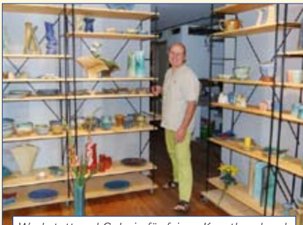
Werkstatt und Galerie für feines Kunsthandwerk

Im offenen Atelier können Sie dem Handwerker über die Schulter schauen. ■