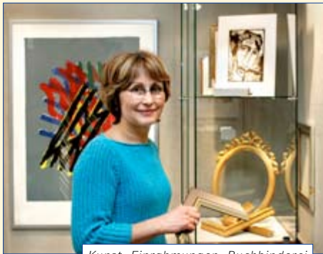
Kunst, Einrahmungen, Buchbinderei

Die Galerie im Herzen der Altstadt zeigt internationale Grafik, zeitgenössische Unikate und ausgesuchte Exponate bekannter Künstler. Sie finden bei uns Arbeiten in unterschiedlichsten Techniken, Sammlerobjekte und dekorative Kunst. Individuelle Beratung ist für uns selbstverständlich. Unsere Fachwerkstatt für Einrahmungen setzt Ihr Kunstwerk unter konservatorischen Gesichtspunkten in das richtige Licht. ■